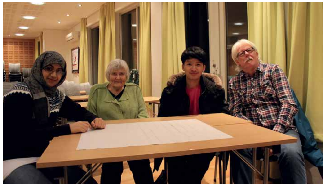
Tre generasjoners treff i all vennskapelighet.

Som et moderne samfunn utvikler vi oss i retning av mer segregasjon, mer ensomhet og mer fremmedhet. Hva kan vi som medlemmer av samfunnet gjøre? En av gruppene snakket om å «så et frø» sammen, unge og eldre og lage en læreplanmål